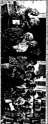
Les lauréats et le jury