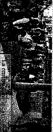
La rentrée des classes

La rentrée des classes a été un peu perturbée par les nouveaux rythmes scolaires. Opposée à la réforme, la municipalité a finalement dû se conformer, sous la contrainte, à appliquer le décret. L'école a donc débuté avec les nouveaux horaires : fin des cours à 15h45 (16h à Ste Croix). Le temps Pelloin prend la suite jusqu'à 16h30 (16h45 à Ste Croix). Pour l'instant, les enfants ont le choix entre aide aux devoirs ou jardinage.